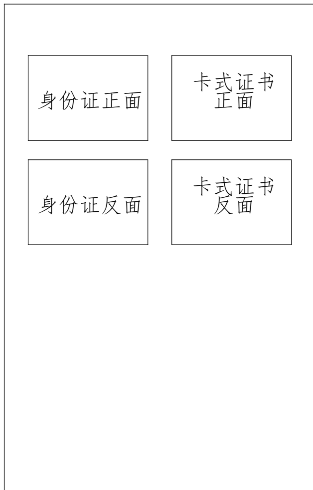
复训卡式证书复印件样版 (A4 纸纵向):